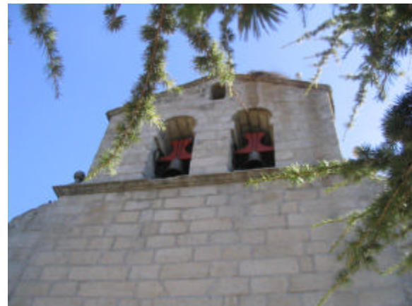
'n Katolieke Kerkie in Fresnedillas