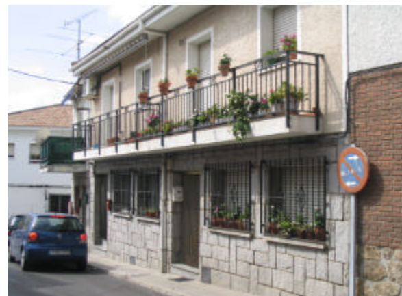
'n Gebou in Valdemorillo