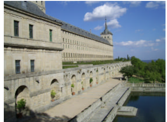
'n Enorme Rooms Katolieke Klooster in El Escorial.