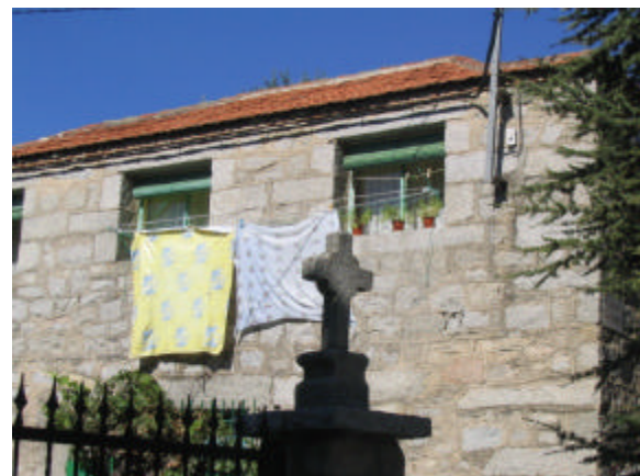
'n Gebou in Fresnedillas