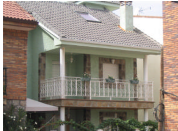
'n Gebou in Valdemorillo