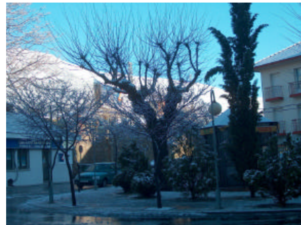
El Escorial in die winter